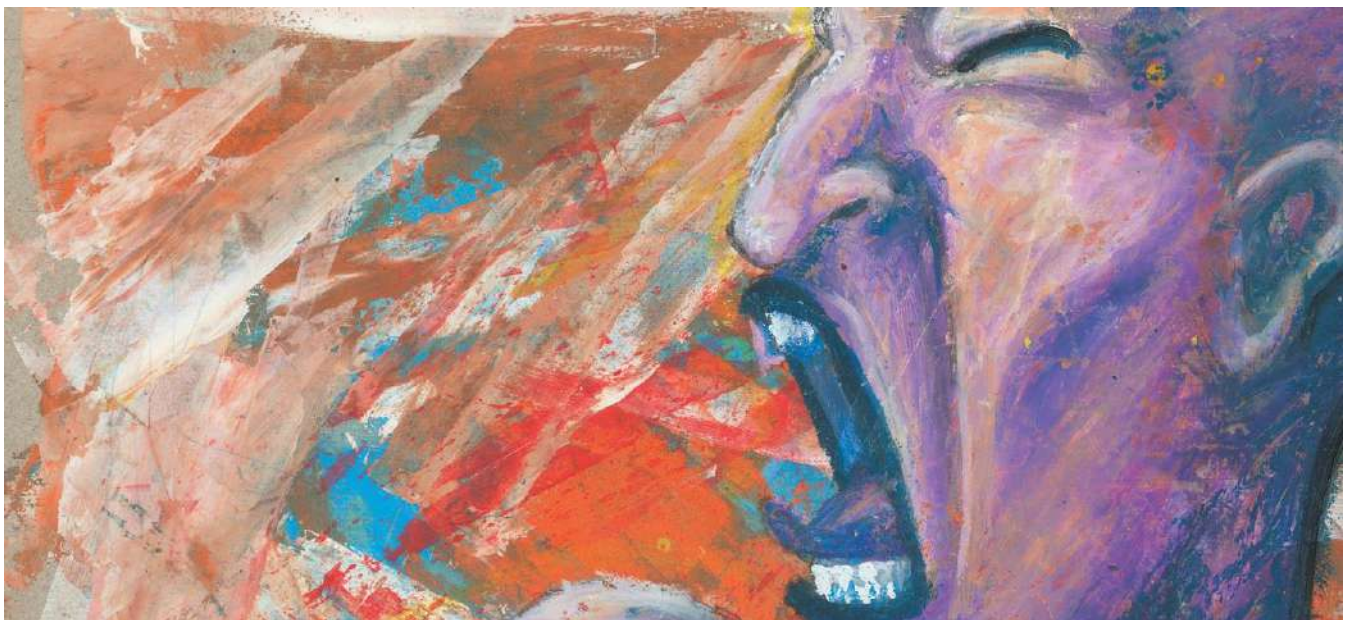
Dibujo de Kerol, Comunità San Patignano

Un facilitador u operador de teatro social conduce actividades teatrales en una serie de contextos sociales y comunitarios, lo que supone que creen un teatro directamente conectado y enraizado con la comunidad o grupo que lo ha producido.