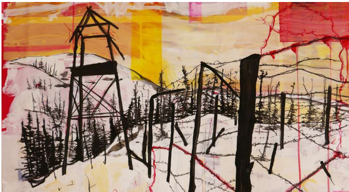
Dibujo de Ruben, Comunità San Patignano

“Cuanto más se deslice el pincel sobre el lienzo, más claro, transparente, natural y simple se vuelve todo para mí. La vida es complicada, y a veces incluso da miedo, pero dibujar es fácil y simple.